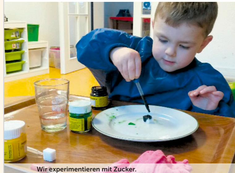
Wir experimentieren mit Zucker.

Unsere Köchin kocht täglich frisches Mittagessen.