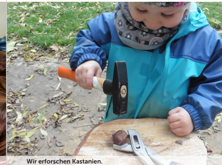
Wir erforschen Kastanien.

Durch dieses »sich Fragen stellen« lernen die Kinder scheinbar alltägliche Phänomene intensiver zu betrachten, wahrzunehmen oder zu erfüllen. Sie erfahren anschaulich, dass ihnen diese Fragen gezielt helfen können, sich in ihrer Welt besser zurecht zu finden und spannende Dinge zu entdecken.