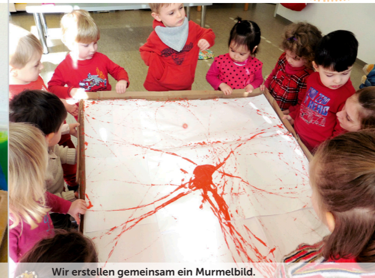
Wir erstellen gemeinsam ein Murretze-Bild.

Wir geben den Kindern Zeit, das Gelernte selbst auszuprobieren.